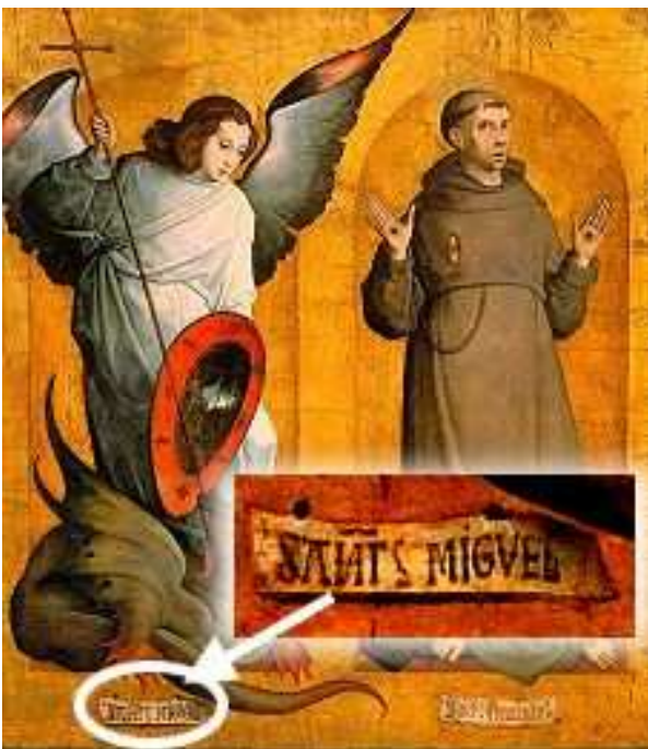
(Juan de Flandres)

Maler wie - Vittore Carpaccio, Juan de Flandres, Fernando Gallego, van der Weyden, Emile Signol oder auch Albrecht Dürer - kannten dieses Symbol und verwendeten es auch in einigen ihrer Werke.